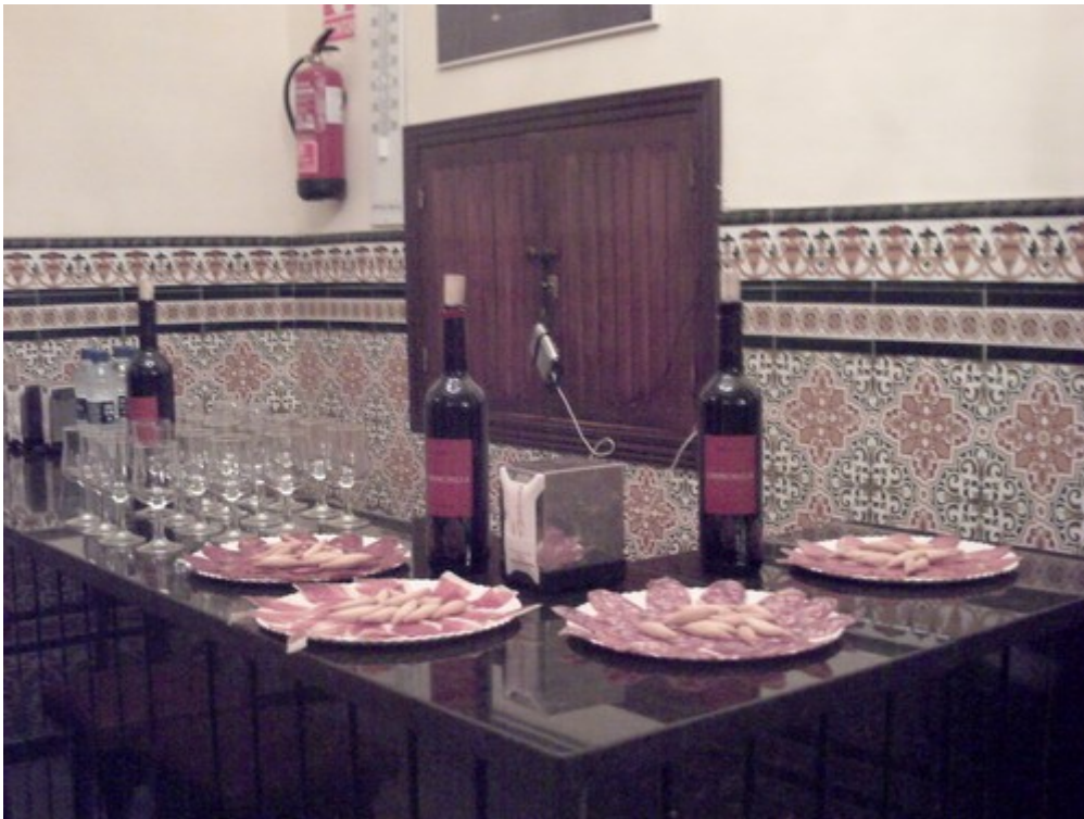
Se sirvió una copa de vinos CHINCHILLA y jamón y quesos de Leocadio Corbacho de la Casa del jamón

Tertulias de Poesías “El Cinco a las Cinco” Organizadas por: