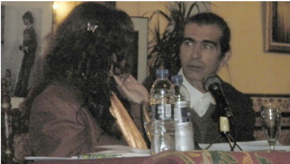
Paco Benitez, autor de las fotografías de la exposición