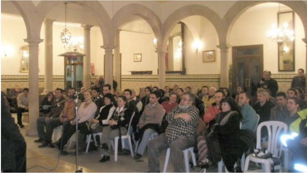
Público asistente a la Tertulia